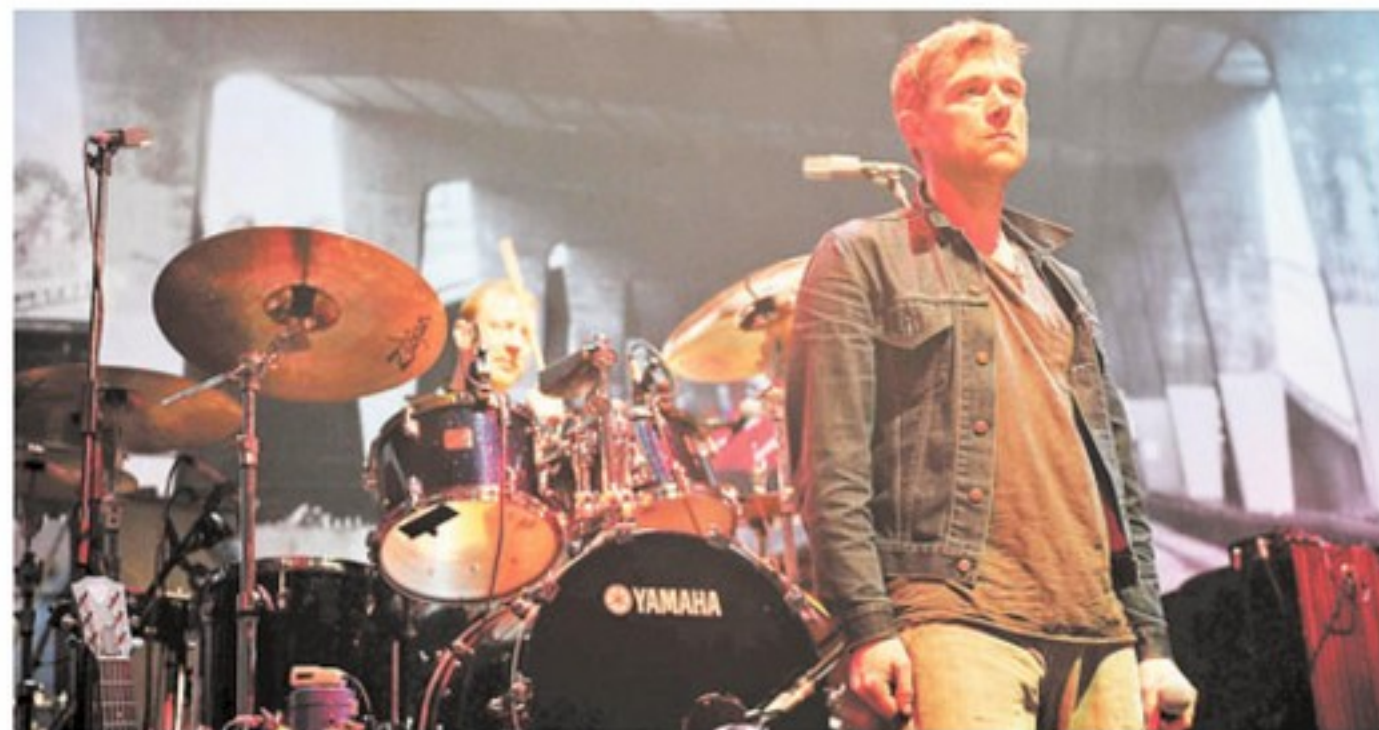
►► Blur, que vuelve en octubre, despachó 2 mil entradas en cinco horas.

torno se negocia para octubre. Junto con esto, y pese a que los productores han advertido sobre un mercado saturado e imposiciones que terminarán afectando al público, la demanda tampoco muestra cambios. Pearl Jam y Violetta llevan más de 40 mil entradas vendidas, los shows de Queen, Blur y Katy Perry despacharon miles de tickets en sus primeras horas, y Chayanne terminó su-